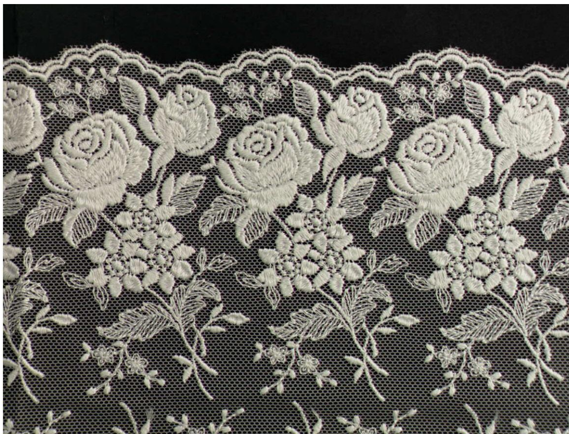
【見本の裏面拡大図】