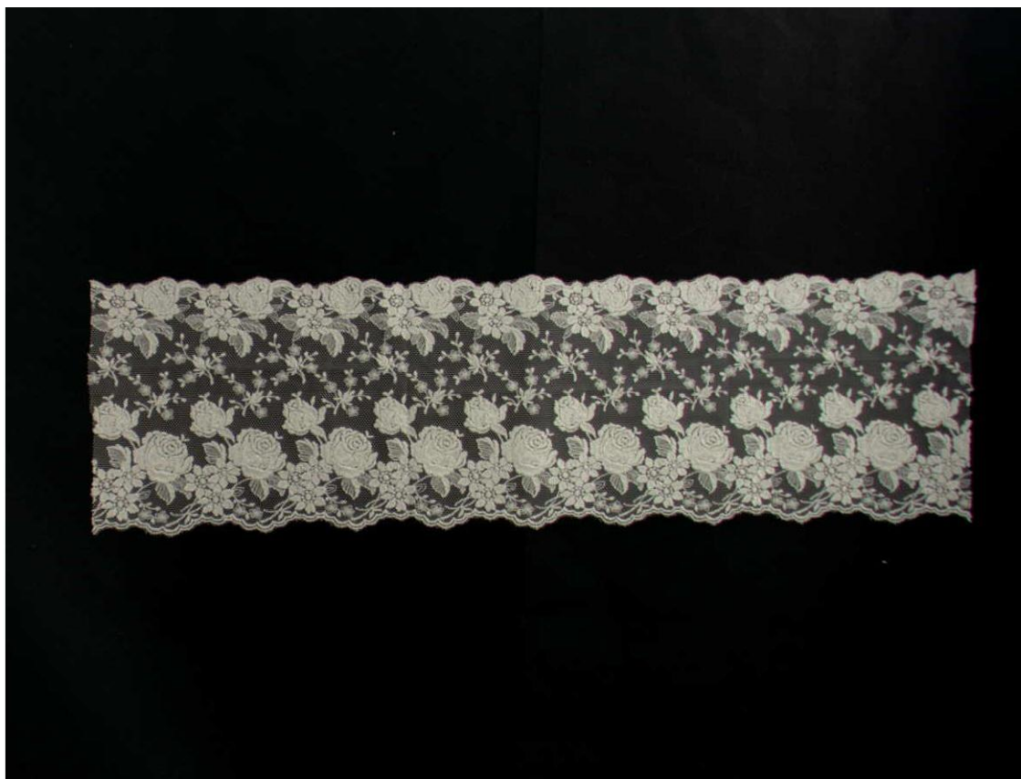
【見本の表面拡大図】